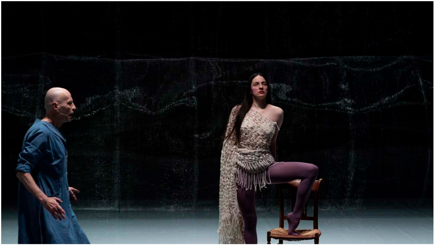
L'Homosexuel ou la difficulté de s'exprimer