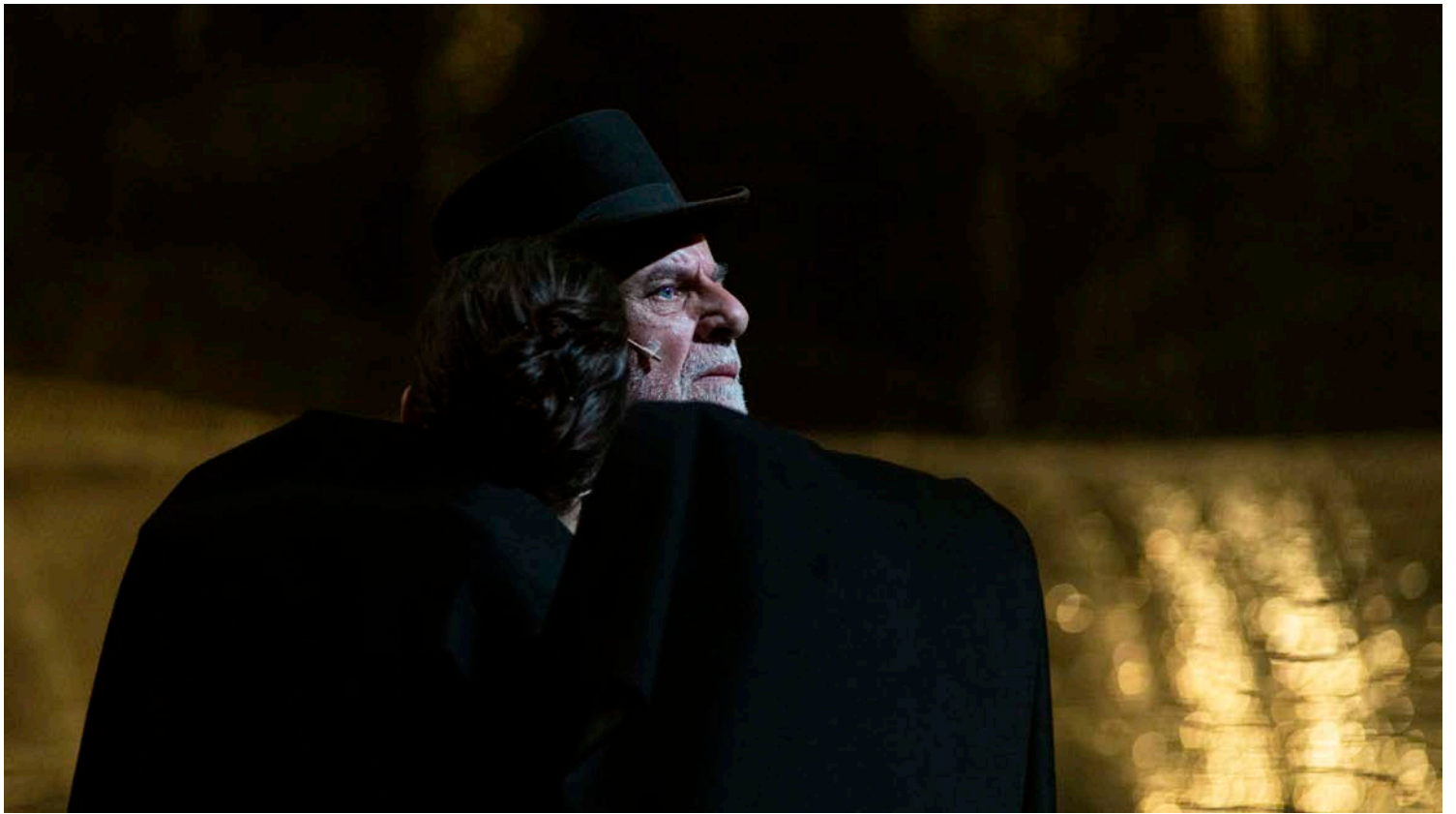
L'Homosexuel ou la difficulté de s'exprimer