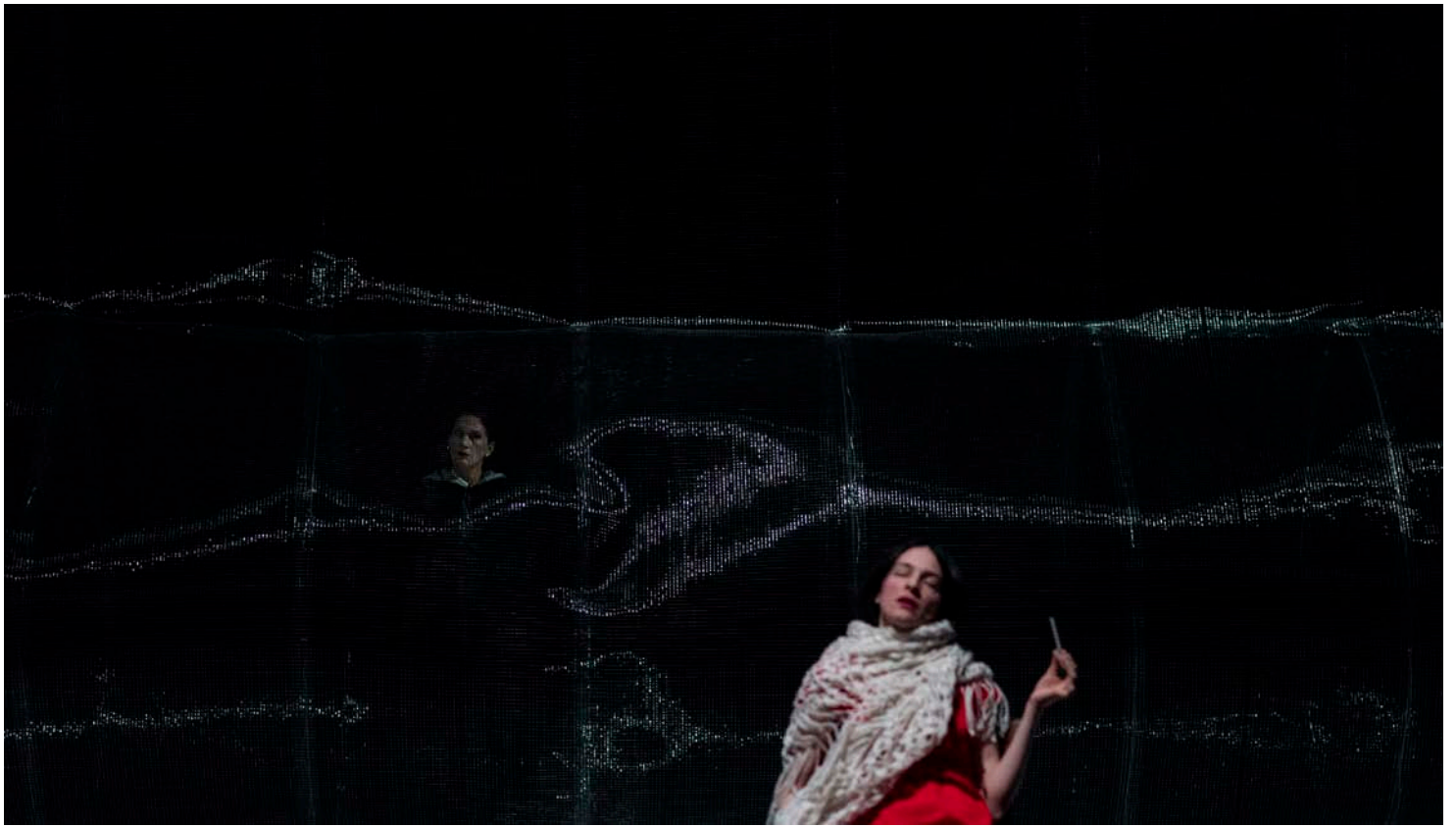
L'Homosexuel ou la difficulté de s'exprimer