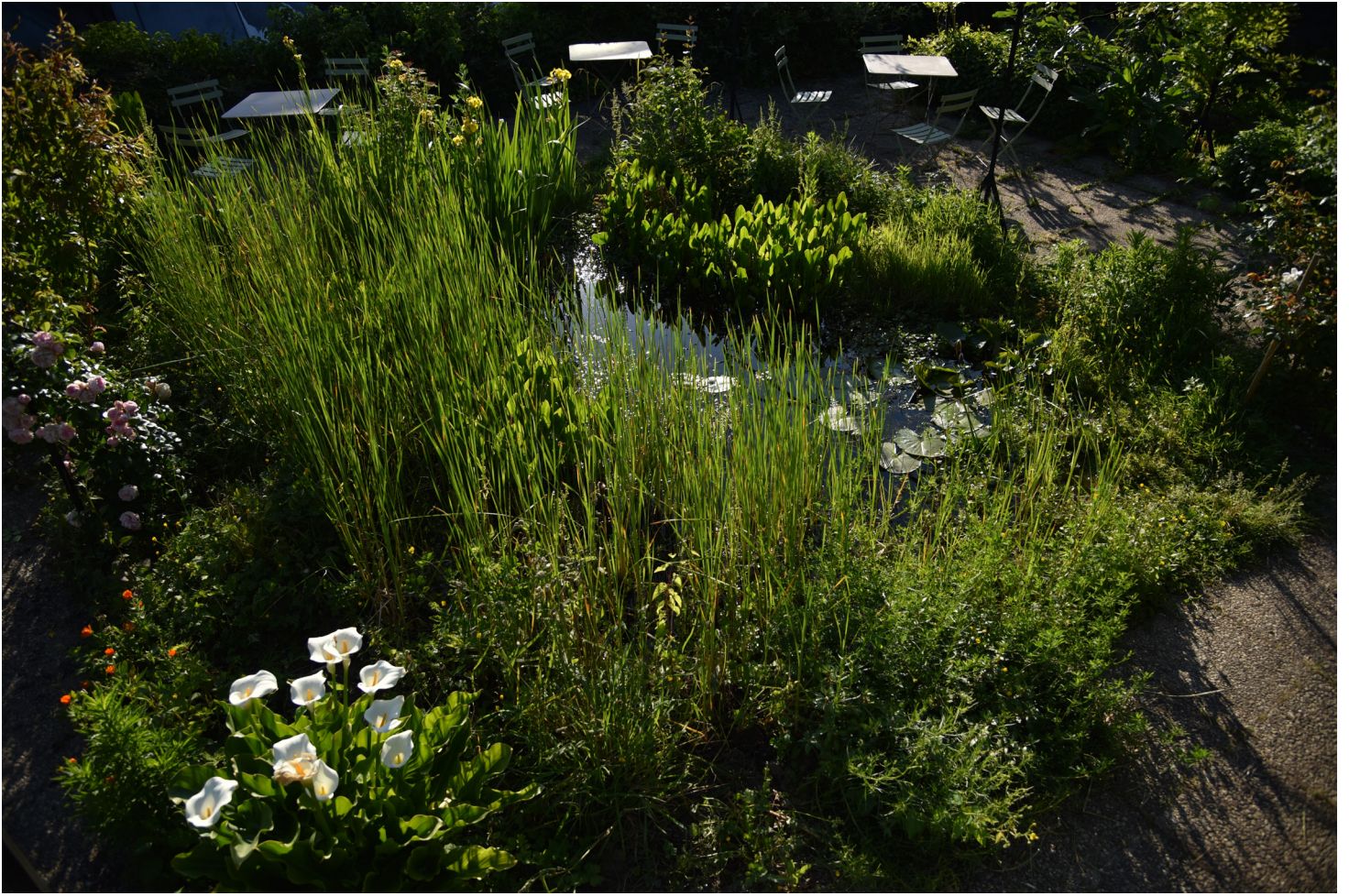
Terrasse du T2G