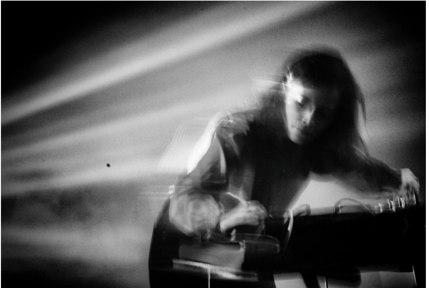
Cate Hortl