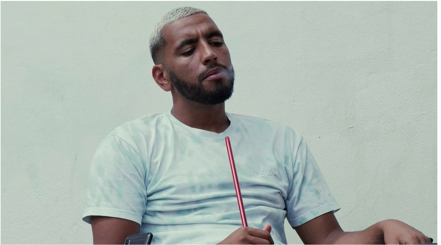
Le Croissant de feu © Rayane Mcirdi