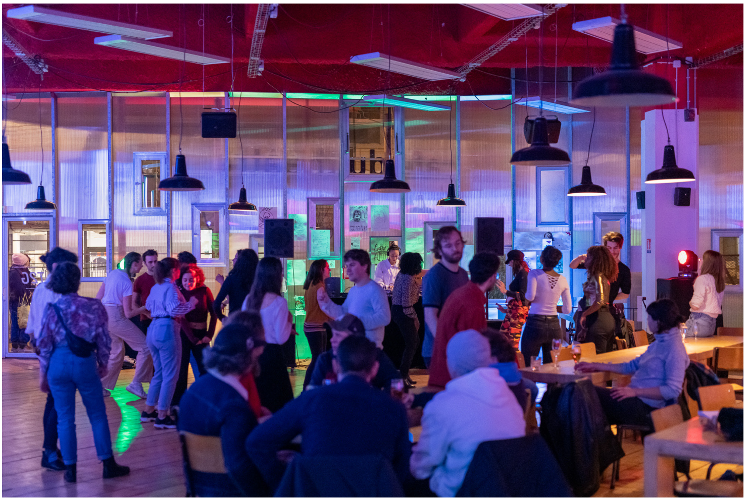
Sur les Bords 4