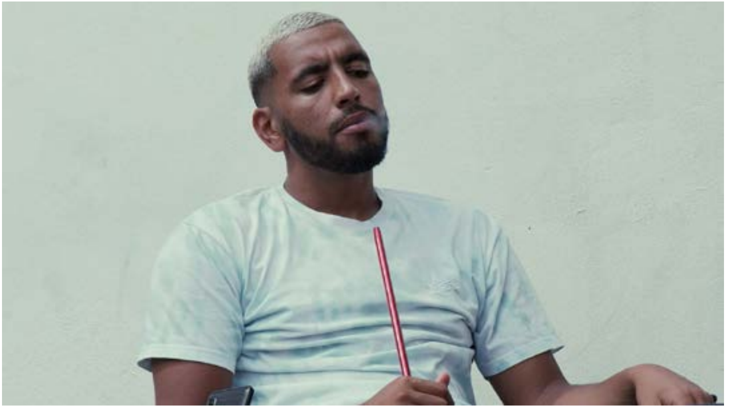
Le Croissant de feu © Rayane Mcirdi