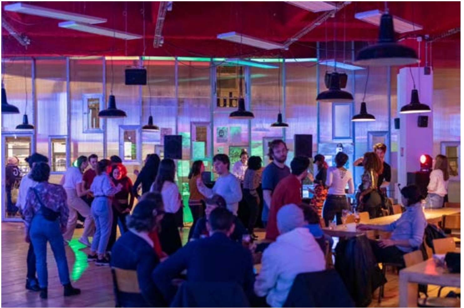
Sur les Bords 4