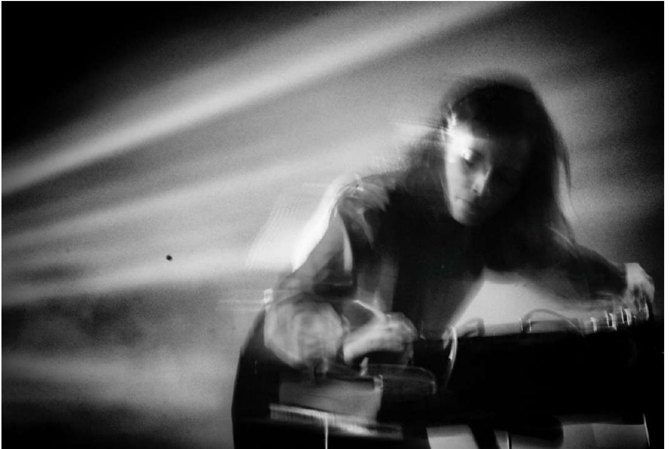
Cate Hortl