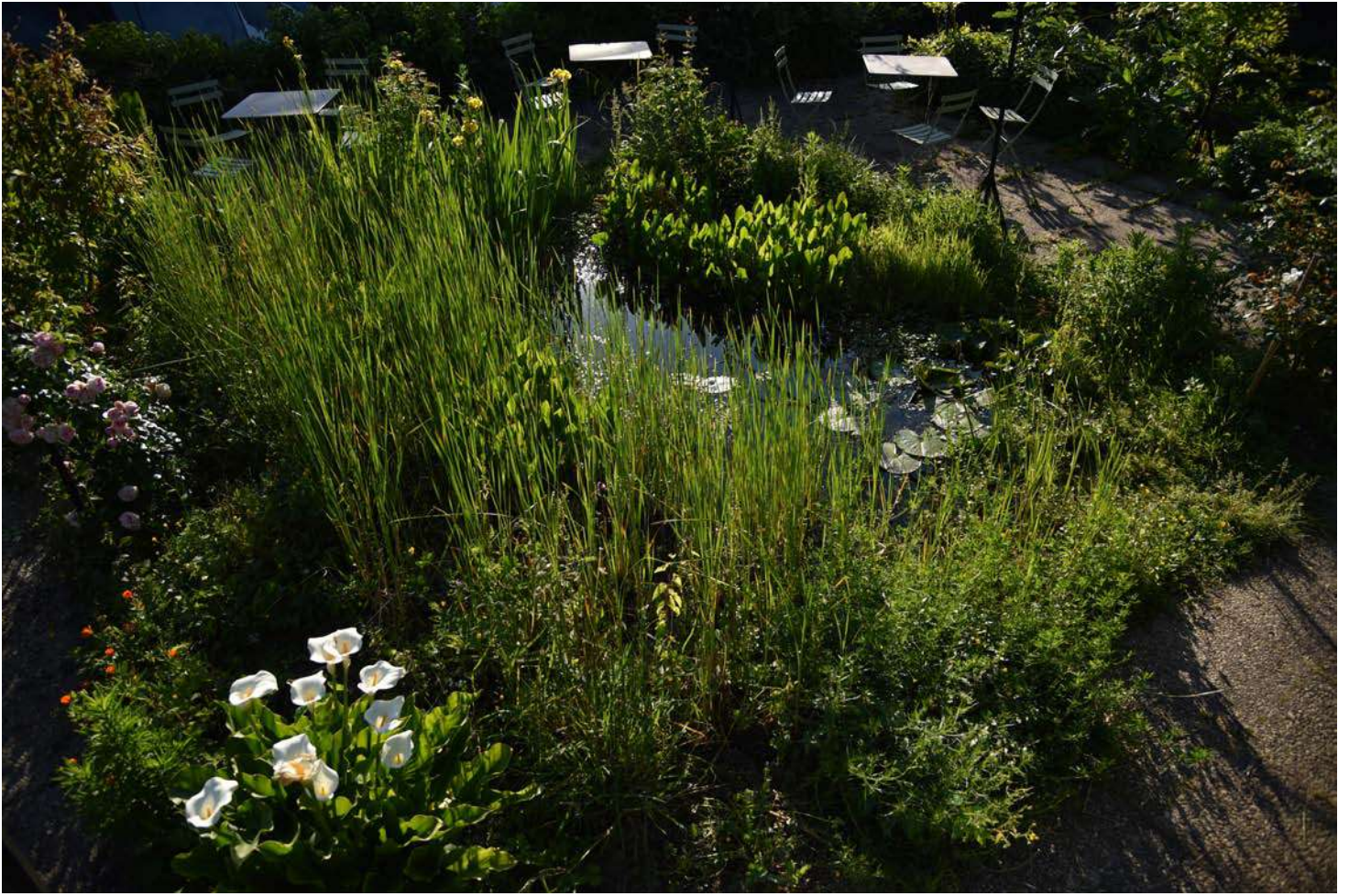
Terrasse du T2G